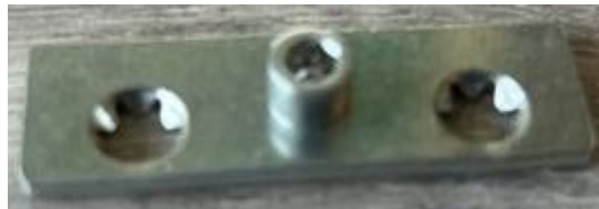
Raam met scharnierpunt